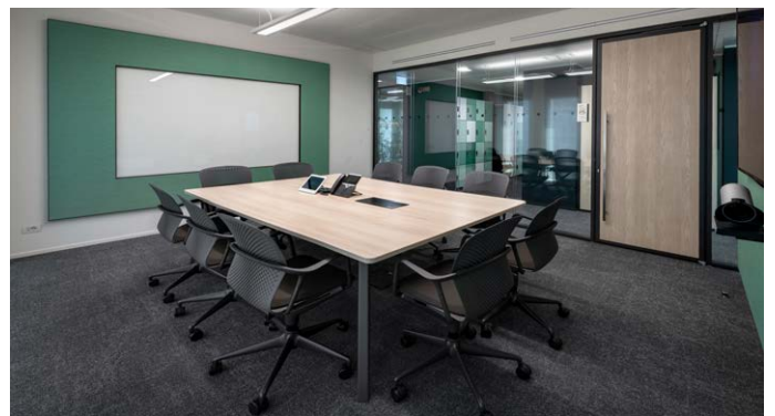
Jeder Meetingraum ist mit Keyn Stuhlgruppen ausgestattet, die auf die Bewegungen der Sitzenden reagieren.