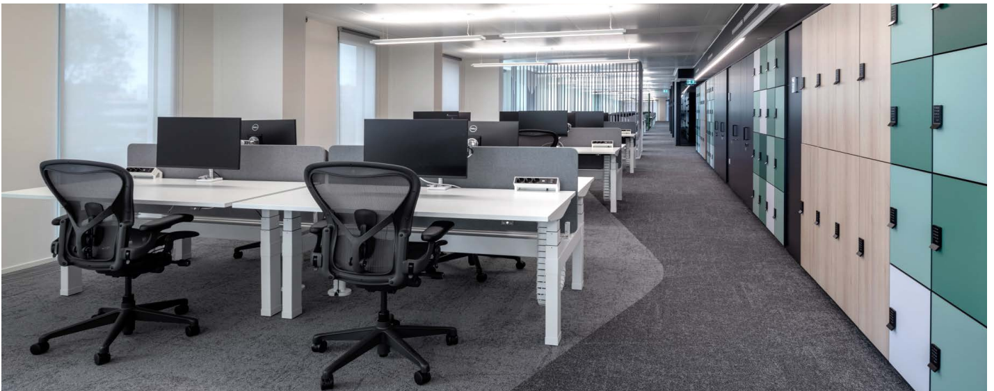
Der Aeron Stuhl mit seinem Ocean Bound Plastic leistet einen Beitrag dazu, dass Oracle Italia seine Nachhaltigkeitsziele erfüllen kann.

Auch in den anderen Bereichen des Büros von Oracle setzen sich die Themen ergonomische Unterstützung und Bewegung fort. Die Sayl Hocker sorgen für Orte, an denen Gruppen sich für eine kurze, intensive Zusammenarbeit treffen können. In den Meetingräumen des ganzen Gebäudes finden sich wiederum Keyn Stühle, die auf die Bewegungen der Sitzenden reagieren.