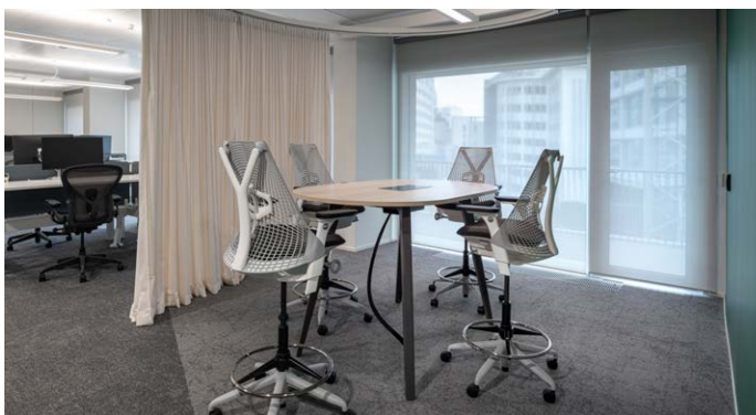
Gli sgabelli Sayl offrono un supporto ergonomico per il lavoro di gruppo mirato.