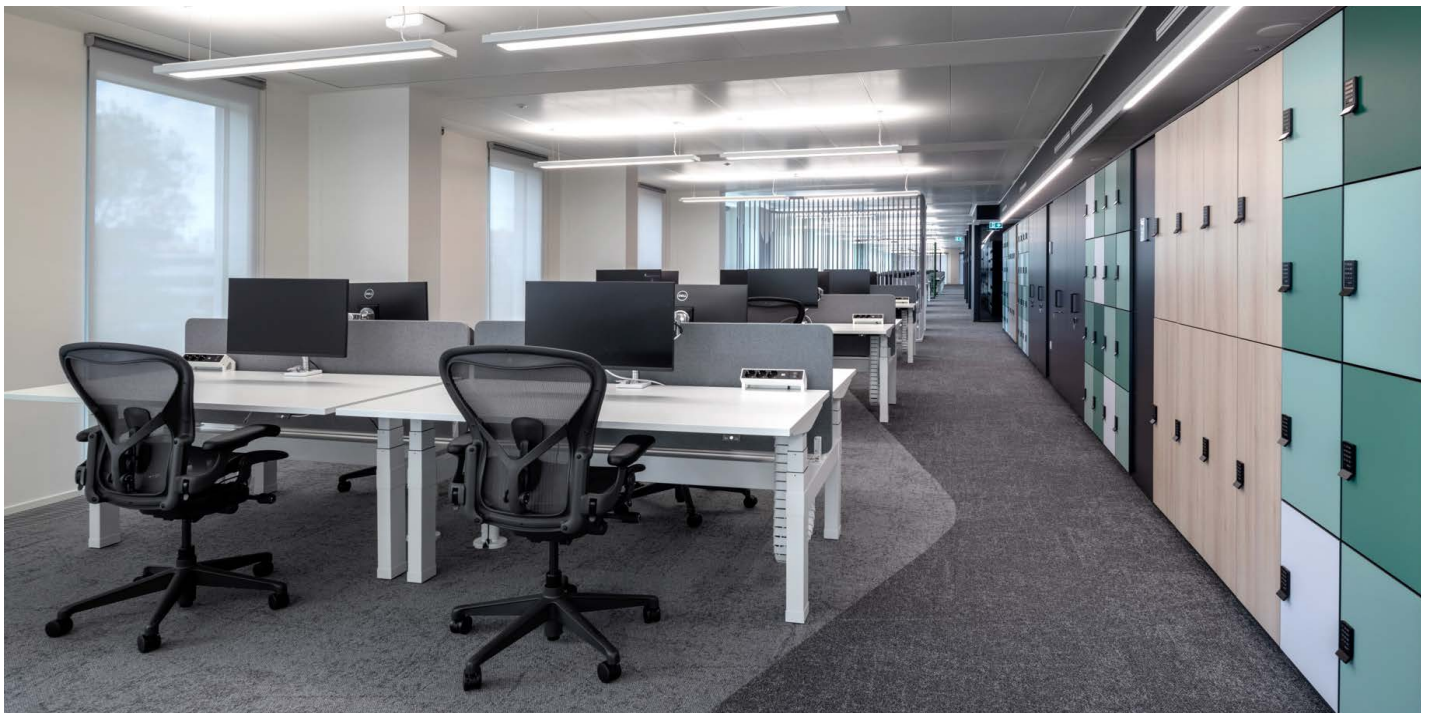
La seduta Aeron con plastica destinata a finire negli oceani supporta gli obiettivi ecologici di Oracle Italia.

Il supporto ergonomico e il movimento sono temi che vengono ripresi anche in altre parti dell'ufficio Oracle. Gli sgabelli Sayl vengono utilizzati per creare luoghi adatti a sessioni di lavoro di gruppo brevi e mirate, mentre le sedute Keyn, che offrono reattività ai movimenti dell'utente sul sedile, sono state adottate nelle sale riunioni di tutto l'edificio.